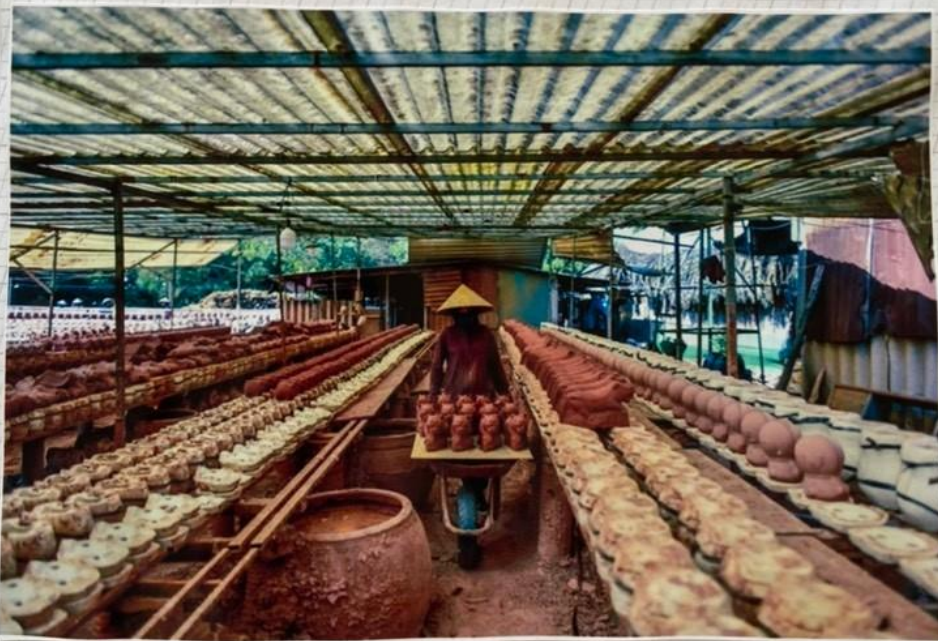
Tân Vĩnh Hiệp sản xuất linh vật hồ vàng nhân dịp Tết Nhâm Dần 2022 (6)