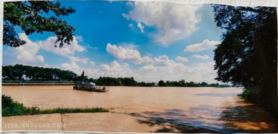
Cù lao Bạch Đằng thí điểm trở thành làng thông minh giai đoạn 2020-2025 (5)